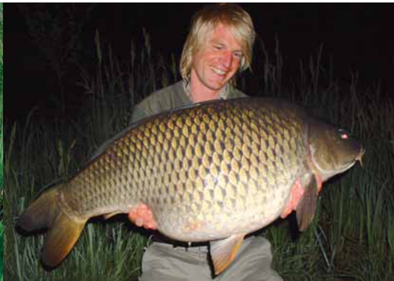
Der letzte Fisch unserer Tour.

ge Monoschlagschnur, dazu ein Safety-Clip mit Zip-Bomb und ein schwarzes 40lb-Amnesia-Vorfach mit 40 Zentimeter Länge. Die Montage schnitt nach einem Biss gut durch das Schilf. Die durch das relativ lange Vorfach aus Monofilament erzielte hohe Dehnung und der kräftige Gamakatsu-Spezialist-Hook (Größe 1) verhinderten ein frühzeitiges Aussteigen der Fische. Als Haar diente ein dünnes geflochtenes Vorfach, an dem ein Snowman, bestehend aus einer 18mm-Fischkugel (M+M Baits oder X-treme Baits) und ein 14mm Pop-up (DD-Bait), angeködert war.