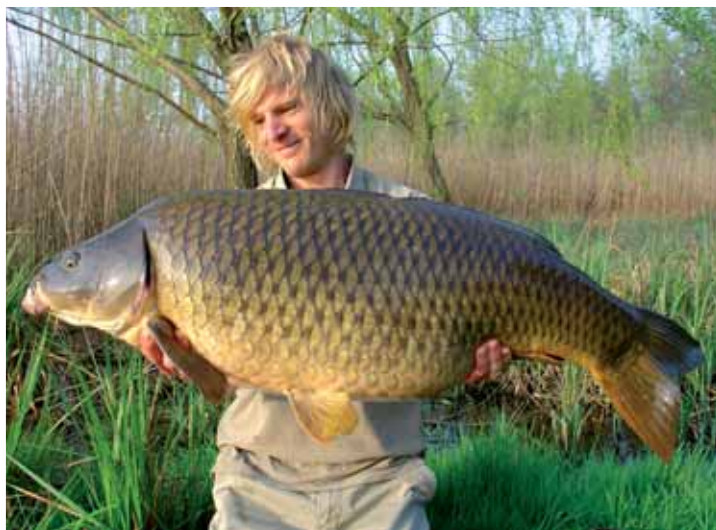
Es gibt auch lange schlanke Italiener.

Je dichter das Schilf war und je ausgehnter es sich in den See zog, desto mehr Karpfen entdeckten wir. An solchen Stellen konnten wir auch einige größere Exemplare beobachten, langsam