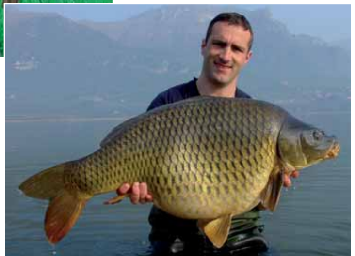
Ein traumhafter Fisch, vor traumhafter Kulisse.

In dieser sandigen, teilweise gar schlammigen Bucht, durchsetzt von Krautfeldern, bissen in den folgenden Nächten regelmäßig ein bis zwei Karpfen. Damit war zumindest ein produktiver Platz gefunden. Während einer von uns diesen Platz befischte, machte sich der andere auf die Suche nach einem weiteren Spot. Es war Anfang April, das Oberflächenwasser hatte anfangs noch