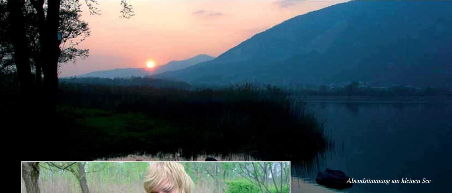
Abendstimmung am kleinen See