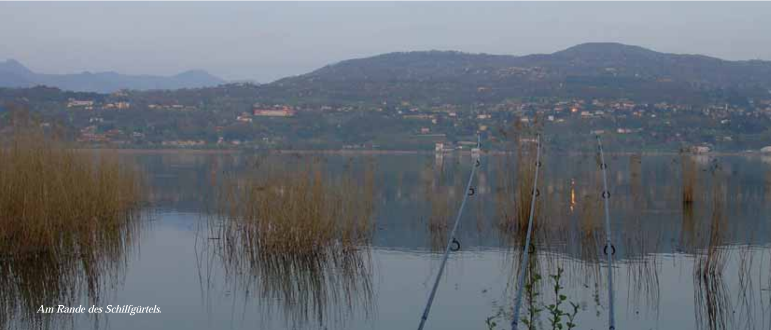
Am Rande des Schilfgürtels.