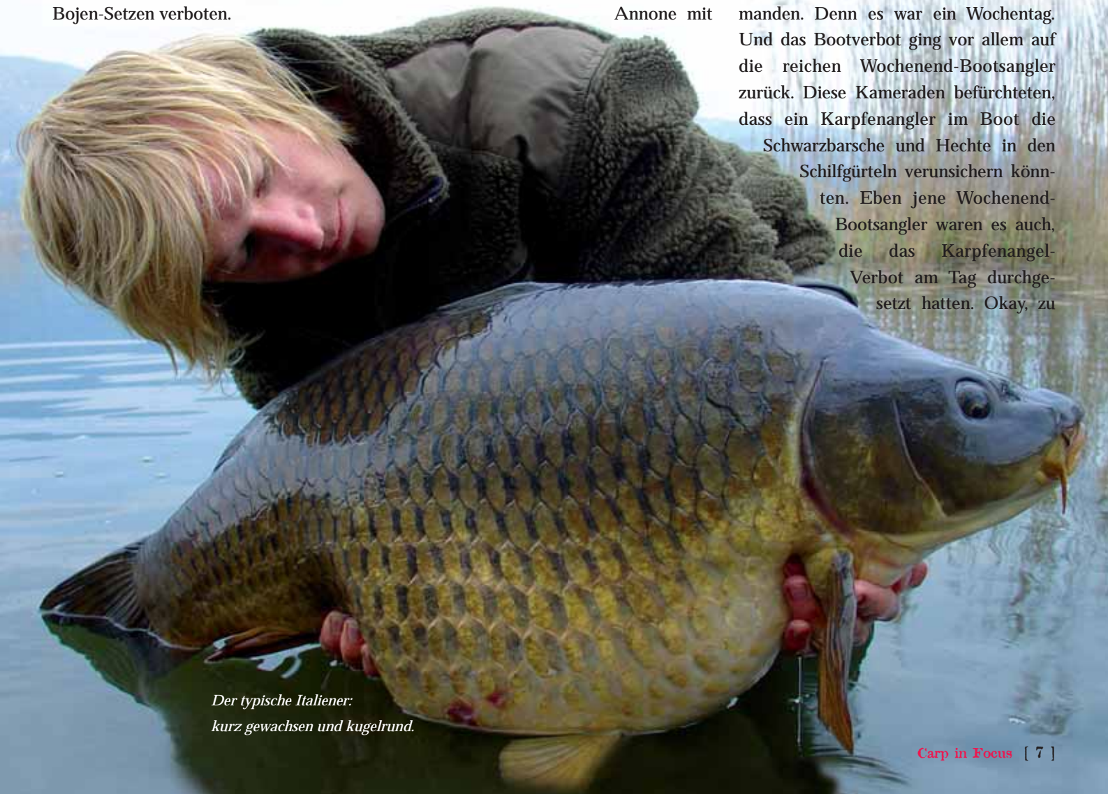
Der typische Italiener: kurz gewachsen und kugelförmig.

einem Verbrennungsmotor befahren dürfen. Später setzten wir unsere Entdeckungsreise mit den Faltbooten fort. Damit verstießen wir zwar gegen das Gesetz Nummer 2, dem Verbot von Bootfahren am Tag. Doch das störte niemanden. Denn es war ein Wochentag. Und das Bootverbot ging vor allem auf die reichen Wochenend-Bootsangler zurück. Diese Kameraden befürchteten, dass ein Karpfenangler im Boot die Schwarzbarsche und Hechte in den Schilfgürteln verunsichern könnten. Eben jene Wochenend-Bootsangler waren es auch, die das Karpfenangelverbot am Tag durchgesetzt hatten. Okay, zu