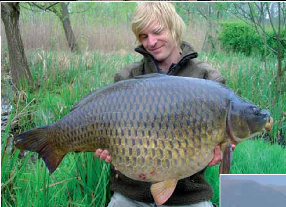
Nach langer Suche, endlich gefunden.

ihrer Entschuldigung sei erwähnt: Diese Raubfisch-Bootsangler müssen satte 3000 Euro für ihre Jahreskarte berappen. Aber zurück zu unserer Suche nach einem geeigneten Angelplatz. Ein schwieriges Unterfangen, da das Ufer wegen des dichten Schilfgürtels nur schwer zugänglich war, zudem fanden wir kaum größere Flachwasserbereiche mit festem Grund.