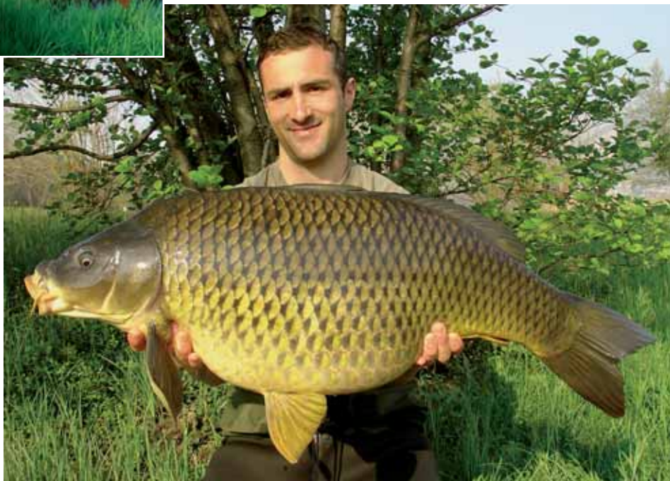
Noch ein prächtiger Schuppi aus dem kleinen See.

Als wir dann Bisse bekamen, setzten sich die Fische sofort im Schilf fest. Dort konnten wir sie manchmal nur per Rüsselgriff mit der Hand landen. Kein einfaches Spiel, denn die Karpfen waren keineswegs ausgedrillt. Und doch ging unsere Rechnung auf: Von 25 Bissen verloren wir lediglich drei Karpfen. Auch Verletzungen traten nicht auf, da sich die Karpfen in dem extrem flachen Wasser kaum fortbewegen konnten. Als geeignete Methode, um die Fische vor Verletzungen zu bewahren und sie sicher landen zu können, erwies sich eine kräfti-