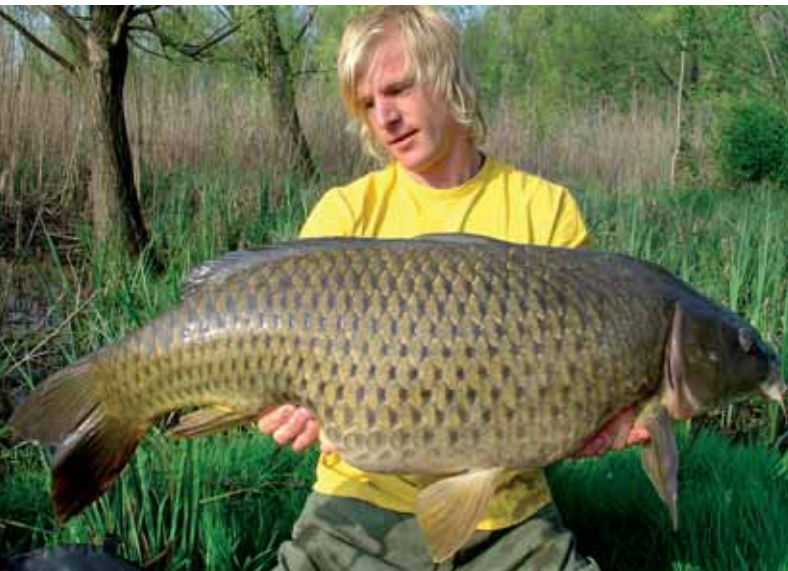
Kein Osterhase- ein Osterkarpfen.