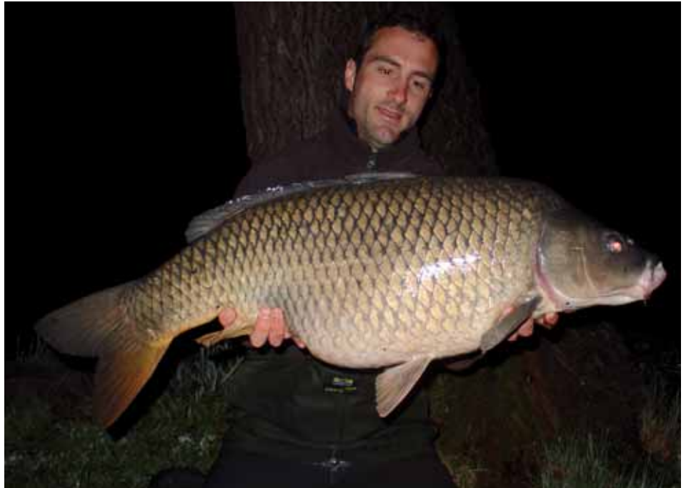
Einer unsere ersten Fische.