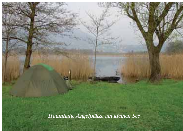
Traumhafte Angelplätze am kleinen See

Basel und durch den Gotthard-Tunnel erreichten wir am frühen Morgen den Lago di Annone. Voller Entdeckungsdrang erkundeten wir zunächst das leichter zugängliche Südufer. Zu unserer Überraschung trafen wir auf keine anderen Angler. Die meisten potentiellen Angelstellen des südlichen Ufers lagen an dem kleineren der beiden Seeteile, in einer Art Park mit Trimm-Dich-Strecke. Wir waren skeptisch und fragten uns, ob man dort überhaupt angeln darf. Wir wollten uns keinen Ärger einhandeln, also suchten wir nach Alternativen. Am südwestlichen Teil des großen Sees war das Ufer nur schwer zugänglich. Ein dichter Schilfgürtel säumte hier das Gewässer. Außerdem befand sich dort ein großer Teil der Uferstrecke in Privatbesitz. Damit war es auch hier schwierig, einen geeigneten Angelplatz zu finden.