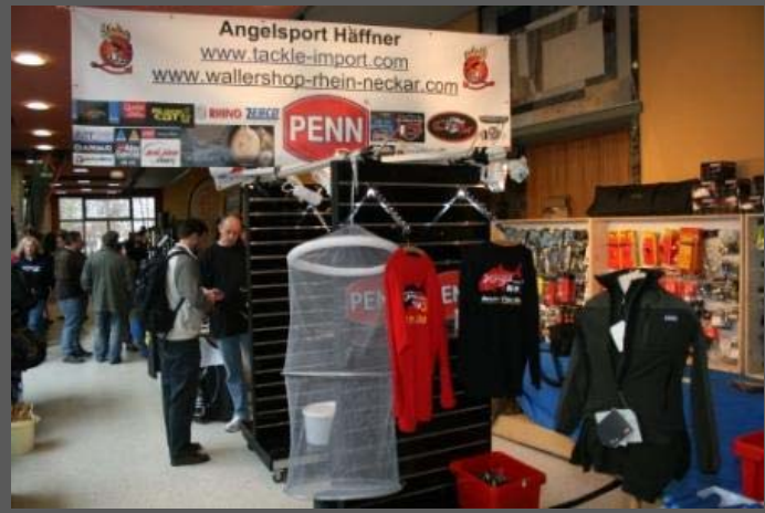
TACKLE-IMPORT, der Spezialist fürs Walleranglen.