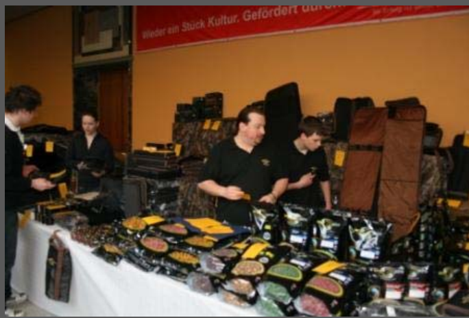
Vive la France – CARP-SPIRIT