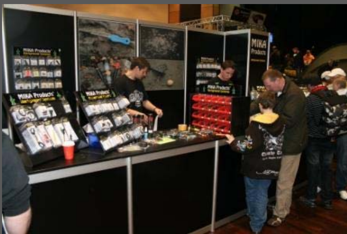
MIKA stellt wie immer innovative Produkte vor.