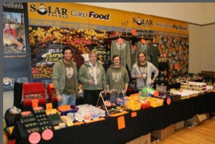
Das Team Germany von SOLAR