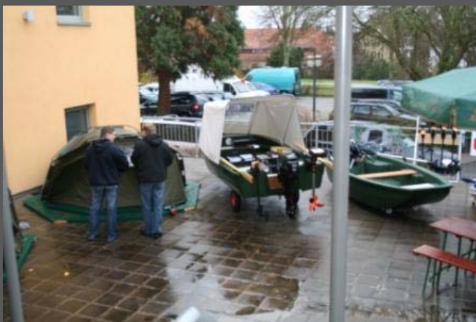
WASSERSPORT MOSER mit Rigiflexbooten