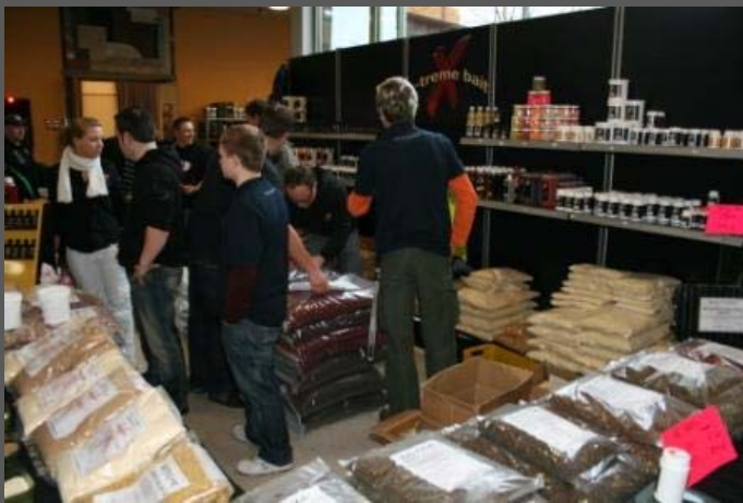
Futter, Futter und nochmals Futter, XTREMEBAIT!