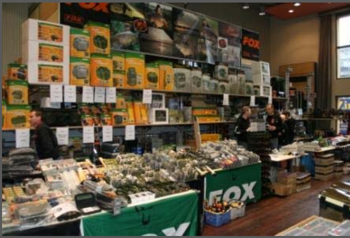
M&R und FOX sind in Speyer nicht mehr wegzudenken.