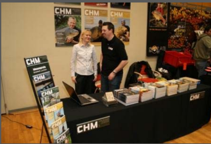
Noch nicht lange auf dem Markt, aber schon in aller Munde, das CHM.