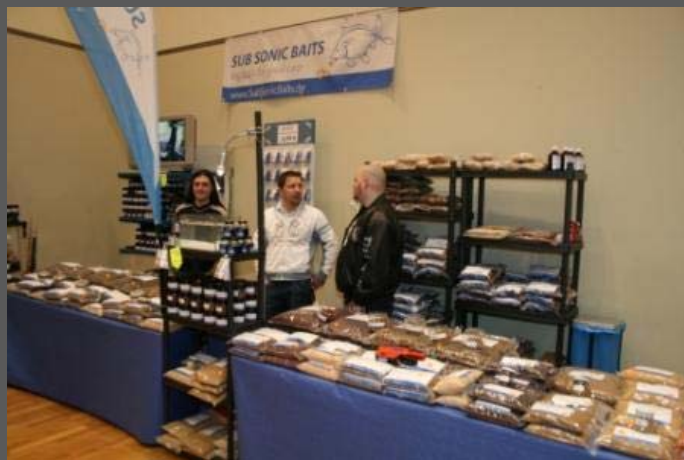
SUB SONIC BAITS