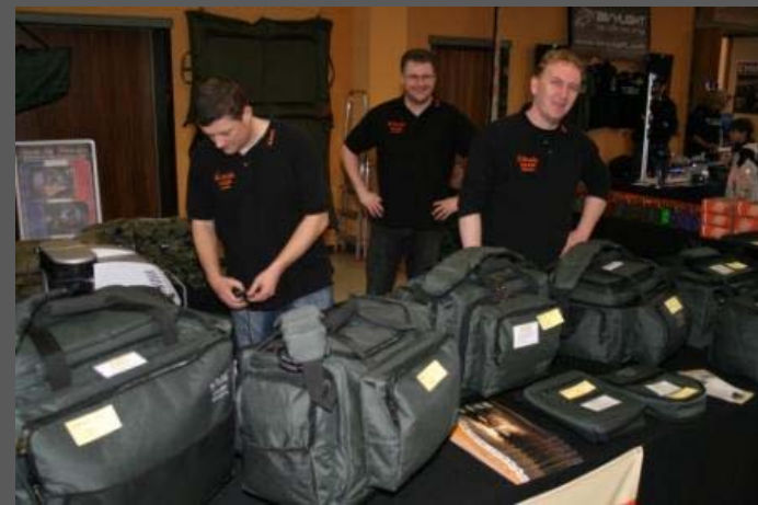
Top Qualität, top Preise - B.RICHI